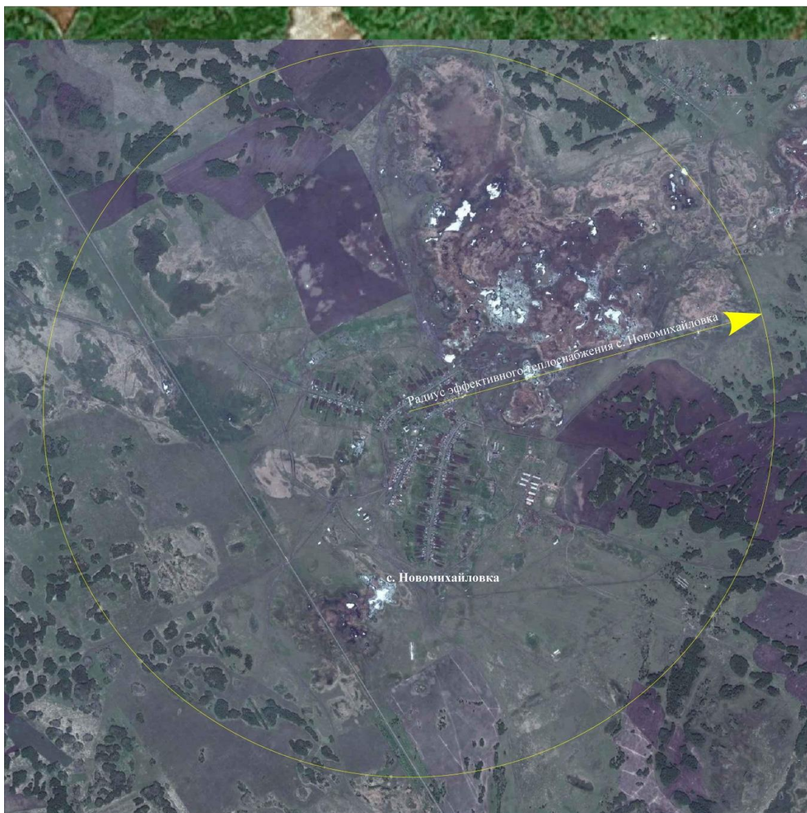
Рисунок 2.1 – Радиус эффективного теплоснабжения с. Новомихайловка

На основании полученных данных можно сделать вывод, что существующая жилая и социально-административная застройка с. Новомихайловка полностью находится в пределах радиуса эффективного теплоснабжения, и подключение новых потребителей в границах сложившейся застройки экономически оправдано.